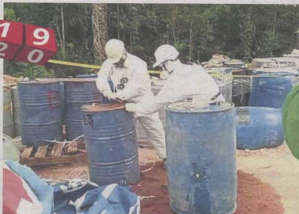
Toxic waste cleanup in the Kampung Sungai Lalang industrial area by Kualiti Alam, a waste management company appointed by the National Disaster Management Agency.

The land would be confiscated if the own-