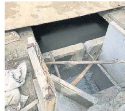
承包商疏忽,没有将住宅区的水引入新的排水道,导致中路淹水。