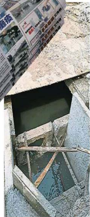
←随着承包商已处理好排水道问题,相信居民不会再受水灾的困扰。