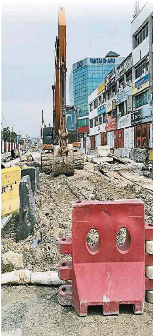
巴生中路淹水的是因轻轨第三路线工程承包商为地下水道进行改道增建工程时疏忽导致。

(巴生29日讯)未妥善处理的地下水道是造成中路和兰花园水灾的“祸首”之一,惟所幸问题已获得解决!