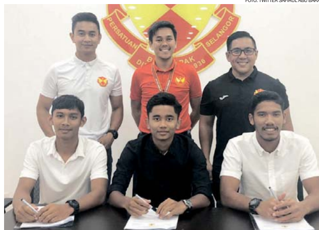
FAS agresif merencana perancangan mengembalikan kegemilangan Gergasi Merah termasuk merekrut 28 bekas pemain AMD sebagai pelapis skuad senior Selangor.

Selain itu, FAS juga komited dengan perancangan untuk membina sebuah pusat latihan tertutup bernilai RM2.2 juta antara