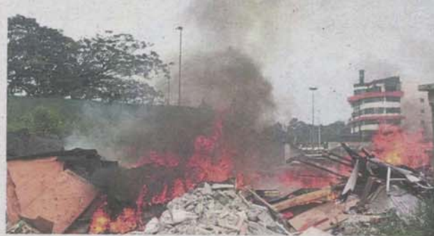
Open burning at the illegal dumpsite next to Silk Highway in Balakong.