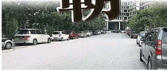
班登柏蘭嶺公園外的道路兩旁,停滿公寓居民的轎車。

“若泊車問題遲遲無法解決,待公寓遷入更多住戶後,屆時相信路邊也會有許多違例泊車的車輛。”