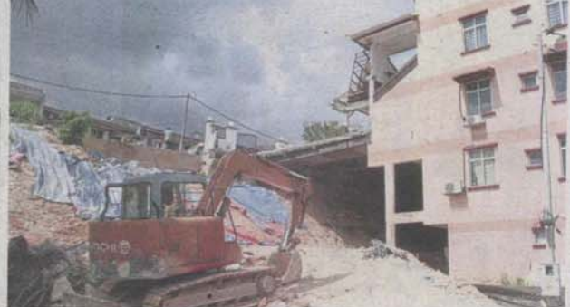
Repair works at Taman Lagenda Mas, Jalan Mas 11, in Cheras due to a landslide.