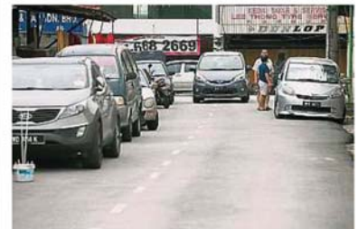
沙登新村SK11/6路原本就狹窄,且一直以來都是單行道,惟自從告示牌脫落后,駕駛人士就將該路段誤認為雙行道。