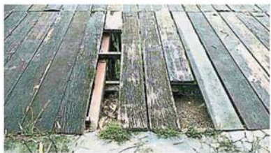
班登柏蘭嶺公園的大部分設施都已破損,包括地板也破了,十分危險。