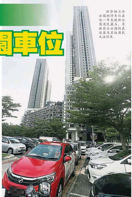
班登柏蘭嶺公園的停車位在近一年來被新公寓居民霸占,導致前去公園的晨運客及其他居民無法停車。