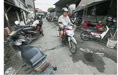
沙登新村SK11/4路隨處可見路洞,摩多騎士被迫左閃右避,小心翼翼行駛。